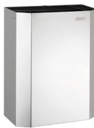
PPA2279C Acabado brillante