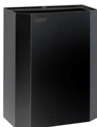
PPA2279B Acabado negro