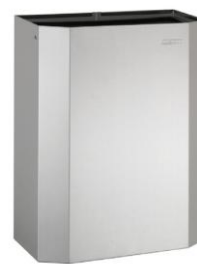
PPA2279CS Acabado satinado