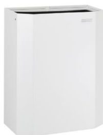
PPA2279 Acabado blanco